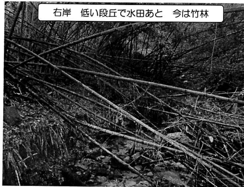
右岸の竹林は昔の水田あと