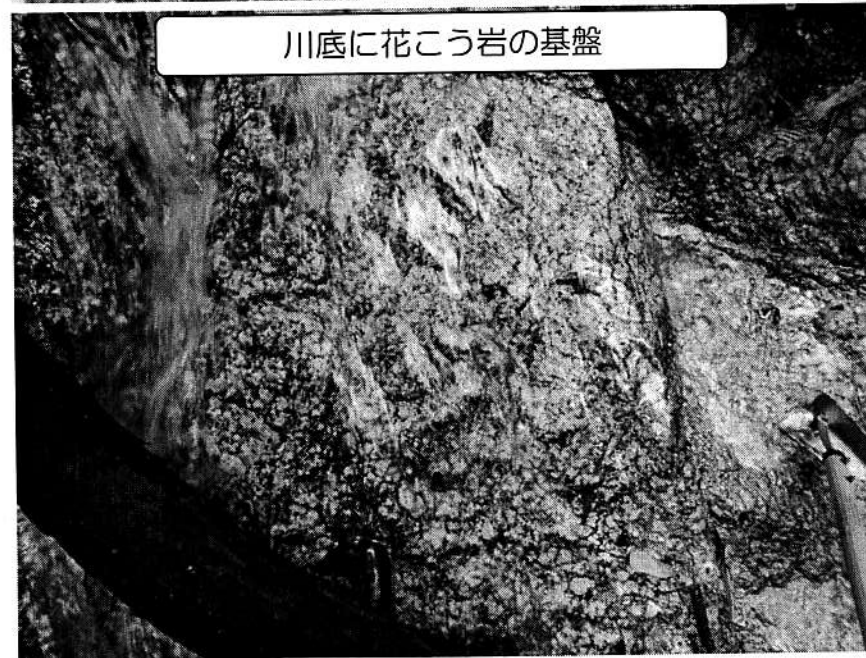
川底に花こう岩の基盤