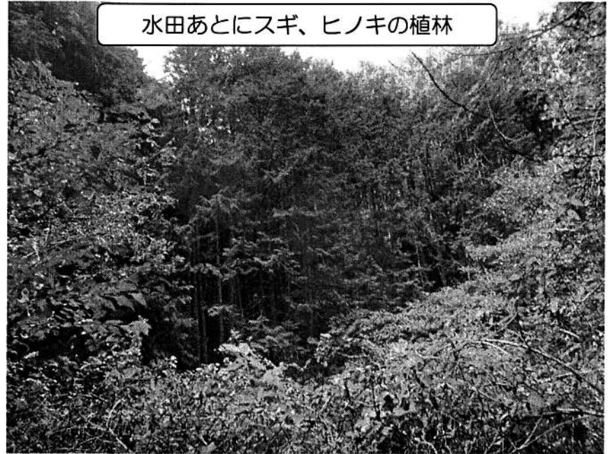
水田あとにスギ、ヒノキの植林