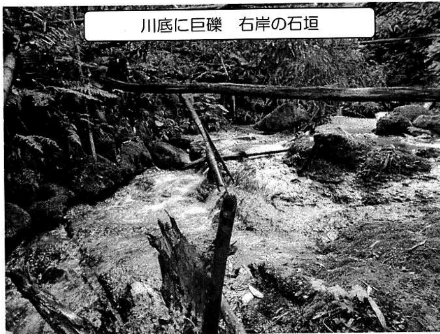
川底に巨礫 右岸の石垣