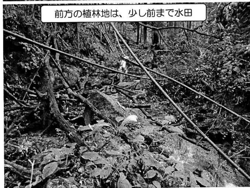
前方の植林地は、少し前まで水田