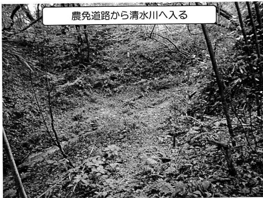
農免道路から清水川へ入る